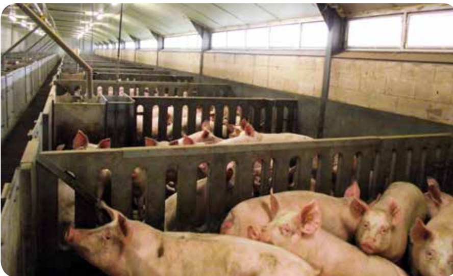
Un bon niveau de bien-être aide l'animal à préserver sa résistance naturelle aux maladies. Tant la santé que le bien-être sont fortement influencés par les conditions d'élevage.