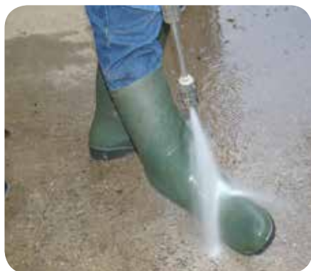
L'objectif de la biosécurité consiste à minimiser le potentiel d'intrusion des organismes pathogènes dans les exploitations via des animaux achetés, des personnes, des véhicules, ...

tenue d'un registre faisant état des différentes observations sont indispensables pour diagnostiquer rapidement des problèmes affectant leur santé ou leur bien-être.