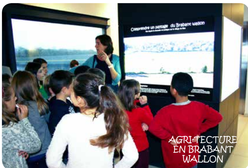
AGRI-TECTURE EN BRABANT WALLON