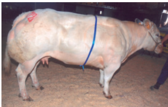
Soigneuse des Alleines (Dandy x Galopeur).

L'élevage des Alleines fait partie des élevages les plus réguliers au provincial et au régional de Libramont. Soigneuse, Vadrouille et Gambade sont quelques unes des femelles les plus performantes dans les rings.