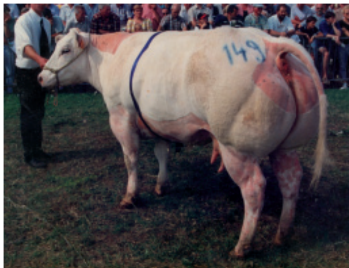
Gambade des Alleines (Indulgent de Somme x Osborne).

Au niveau du partage des tâches, Luc suit davantage la reproduction, la sélection et la traite tandis que Dany assure surtout le suivi des cultures et de alimentation des veaux et gros bovins. Les deux frères peuvent également compter sur l'appui de leur papa (Henri), de deux neveux (Benjamin et Pierre-Emmanuel) et