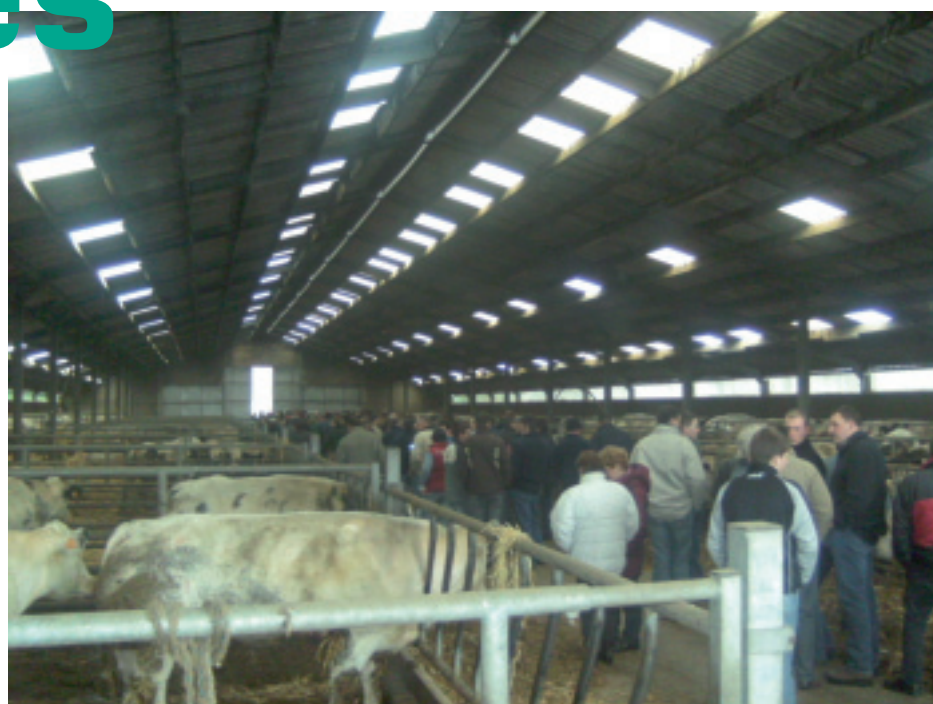
Près de 150 personnes ont suivi cette porte ouverte.

Le bilan classification linéaire du troupeau indique des aplombs dans la moyenne,