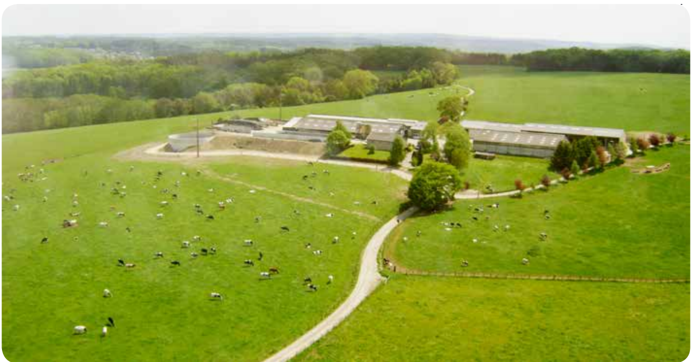
La cession des biens mobiliers, suivie en différé d'une donation des biens immobiliers permet de cumuler les avantages en matière d'aides à l'installation et de limiter les coûts de transmission.