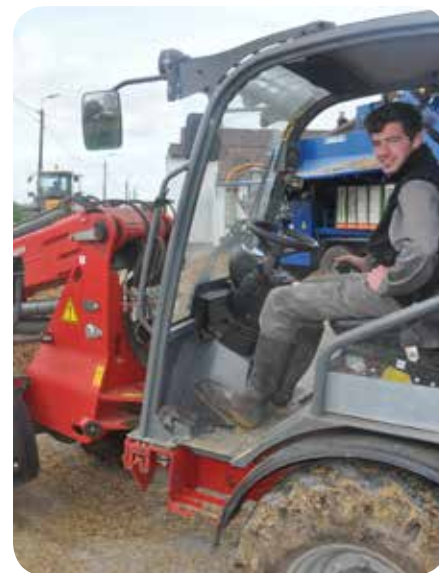
Indépendamment de l'expérience acquise, le jeune doit avoir réalisé un stage de minimum 20 jours ouvrables dans une ferme tierce validé par une structure agréée.