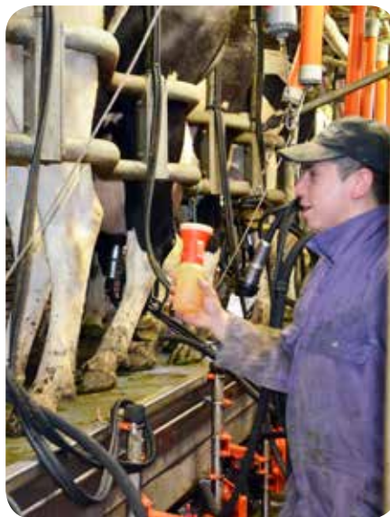
La sélection s'effectue désormais par bloc trimestriel. Les dossiers se voient attribuer des points en fonction d'une série de critères. Vu la durée de la procédure, il est important de ne pas trop tarder pour introduire son dossier.