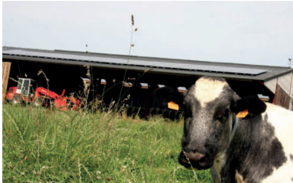
Sur base de l'échantillon situé en Province du Luxembourg, les consommations totales moyennes (énergies directes et indirectes) sont de 3 600 MJ/1000 litres de lait et 2 600 MJ/100 kg de poids vif.