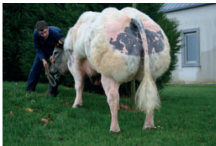
L'élevage est représenté dans les CIA par des taureaux de gabarit au profil élevage comme Libéral ou Lumineux d'Ochamps.