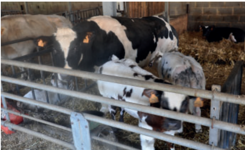
L'aptitude à l'allaitement (pratique du veau au pis) est un critère de sélection très important.

choix de taureaux). La consanguinité des accouplements est testée via le logiciel Ariane (objectif 3,125%). Seuls les taureaux indemnes de tares sont utilisés sauf si le phénotype ou l'origine sont supérieurs avec utilisation très sélective.