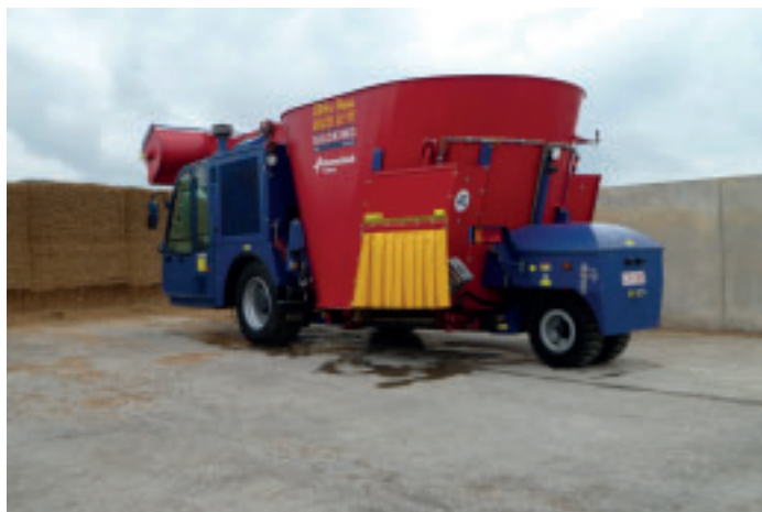
En 2009, la mélangeuse tractée a été remplacée par une automotrice.