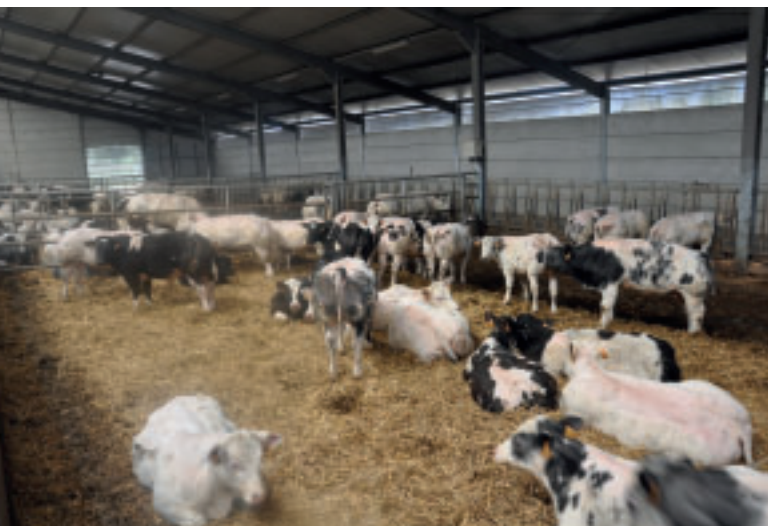
La nouvelle étable assure un logement particulièrement confortable.

Cette visite a été l'occasion de découvrir le niveau de performances qui peut être atteint par un troupeau BBB lorsque sélection, management et organisation du travail sont gérés de manière professionnelle.