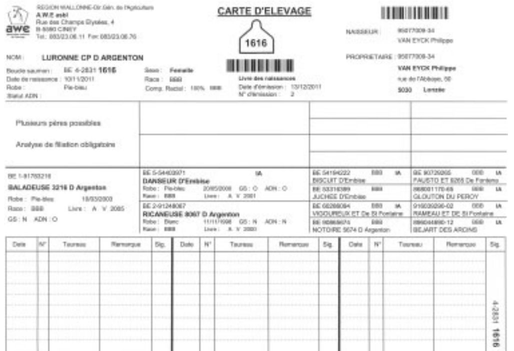
Fig. 3: Carte d'élevage blanche pour une génisse viandeuse inscrite à la naissance et dont l'inscription ne peut pas être validée car on a détecté plusieurs pères possibles.