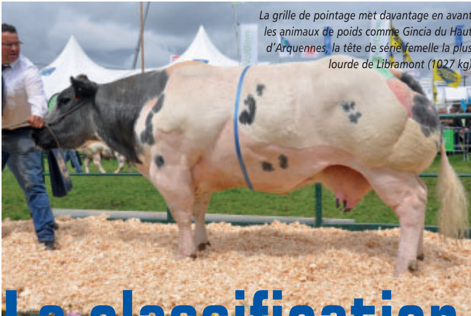
La grille de pointage met davantage en avant les animaux de poids comme Gincia du Haut d'Arquennes, la tête de série femelle la plus lourde de Libramont (1027 kg)