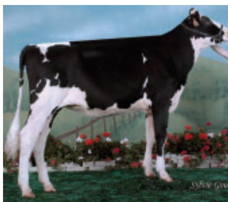
Shoremar Alys Goldwyn (photo génisses en 2007), une des 17 femelles du troupeau du top 200. Sa mère (Shoremar Alys Lee) a été pointée TB 89.

sont à l'heure actuelle, les mieux représentées dans le troupeau. D'autres familles sont très récentes. Ainsi, des gestations par Million de M'Toto Chartreuse, une pleine sœur de Shottle, sont confirmées. D'autres gestations par Savard d'une Red Advent, issue de la sœur de Talent par Outside, parente de la célèbre Lavender Ruby Redrose, remontent à la non moins illustre Blackrose.