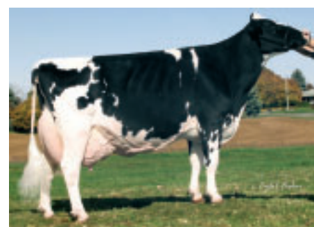
Shoremar S Alicia (EX 95 USA), compte 24 descendantes dans le troupeau.

"Nous sommes avant tout des producteurs de lait." explique Isabelle qui gère l'aspect sélection. "Nos choix génétiques reposent donc sur les critères les plus étroitement liés à la rentabilité, à savoir les valeurs d'élevage et plus particulièrement l'index global de sélection. Le choix des taureaux se concentre principalement sur le top 15 des index américains et