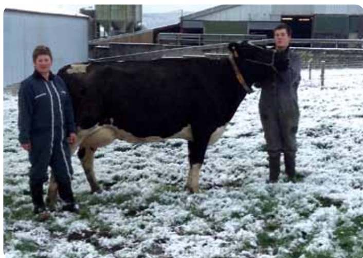
Hachette de l'élevage du Préai (Iron x Winston).

Par le passé l'accent a été particulièrement mis sur la morphologie. Ils sont toutefois désormais plus attentifs à ne pas évoluer vers un gabarit trop important afin de garantir un bon confort dans les logettes. La qualité des aplombs et des bassins restent les priorités aujourd'hui. Les éleveurs envisagent d'ailleurs de disposer des tapis sur certaines parties de l'étable à logettes.