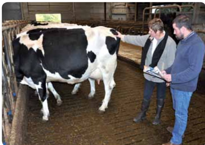
Contrôle laitier, classification linéaire, conseil d'accouplement, le troupeau est suivi par l'AWE asbl depuis une quinzaine d'années.