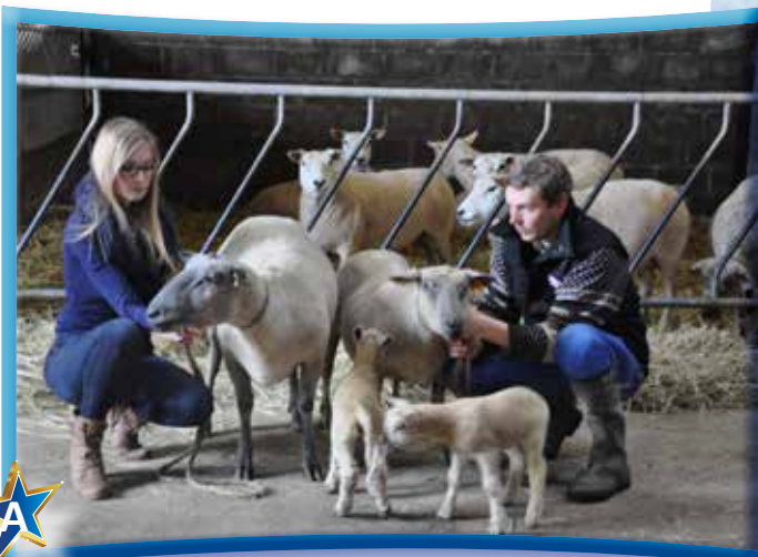
Elevage du Champ des Oies