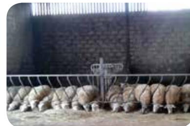
Éleveurs de bovins et ovins – Gedinne

L'élevage du Chant des oies est détenu par un jeune couple Gedinnois. Cédric et Elodie y élèvent un troupeau de bovins Blanc-Bleu Belge, ainsi qu'un élevage de 100 moutons de races Bleu du Maine et Texel français. Ils partagent au quotidien une même passion pour l'élevage. Leur persévérance et leur détermination ont permis de se diversifier et d'améliorer leur cheptel en développant une sélection de qualité.