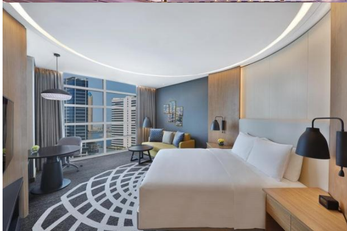
L'hôtel Doubletree Hilton