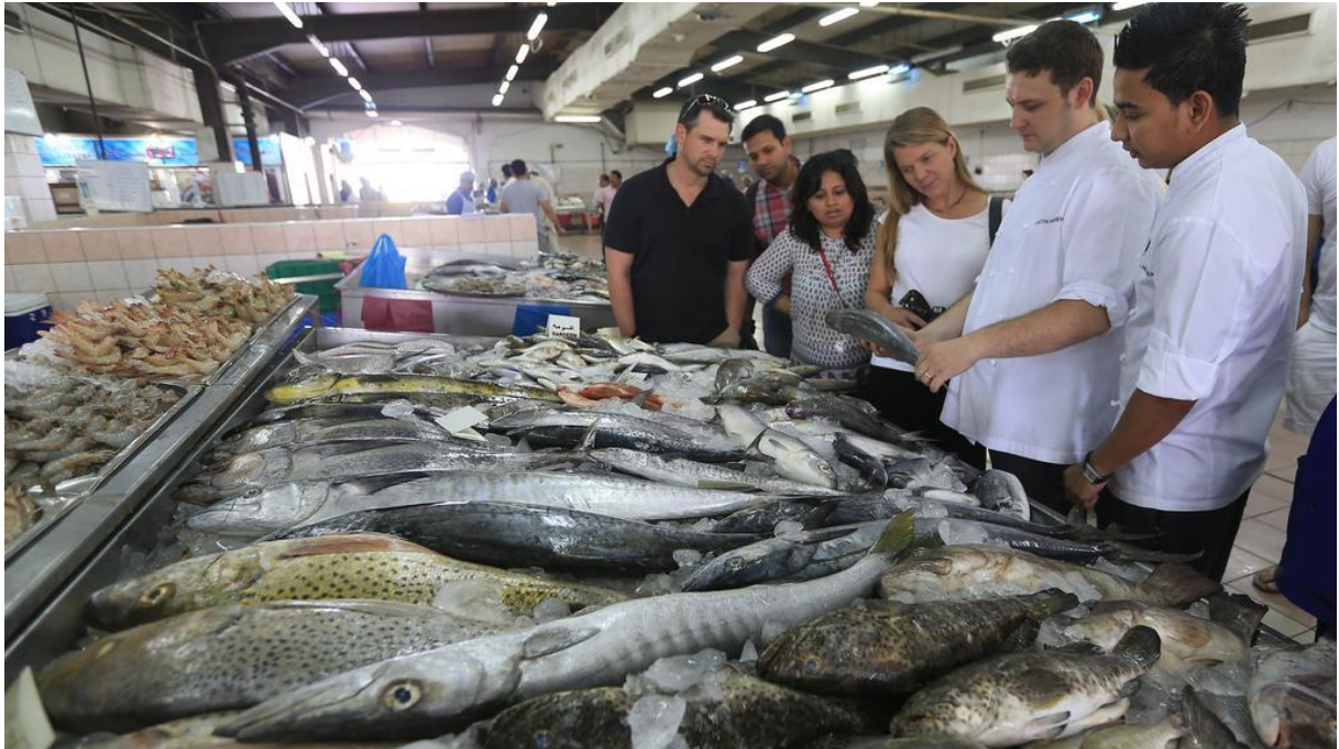
Le marché aux poissons