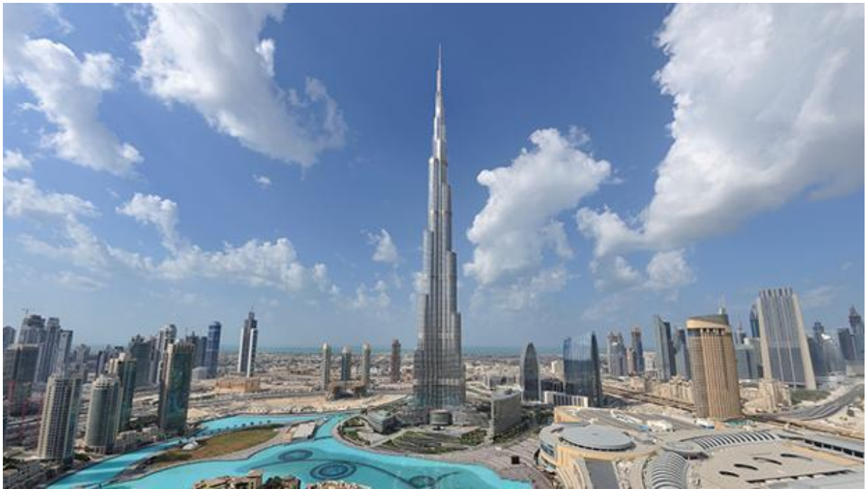
A côté de la tour Burj Khalifa, les autres grattes ciel font figure de nains !

Coût de ce rêve pharaonique : plus de un milliard d'euros !