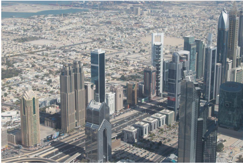
La vue spectaculaire

Jour 4 : A 9h30, pour ceux qui n'ont pas le vertige, possibilité de monter dans la tour Burj Kalifa. L'ascenseur le plus rapide au monde vous emmènera à plus de 500 mètres de haut pour admirer la ville de Dubaï !