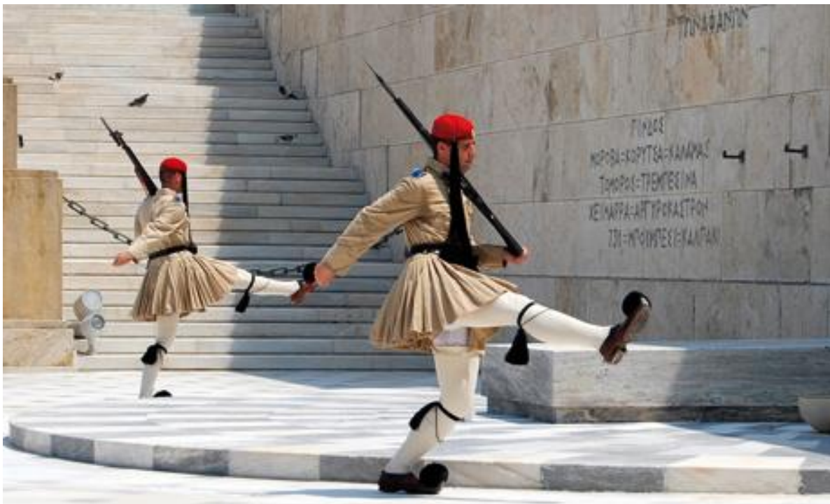
La relève de la garde

Après le diner, route vers Athènes pour la visite de l'Acropole et du Parthénon. Ensuite, tour de ville avec arrêt au Parlement pour assister à la relève de la garde.