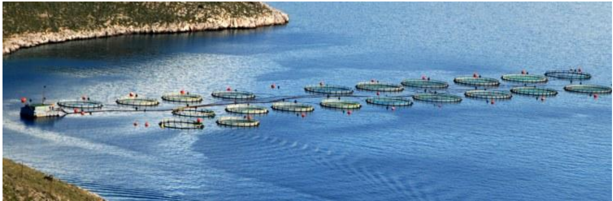
Les bassins d'élevage

95% de la production est exportée vers l'Europe de l'Ouest.