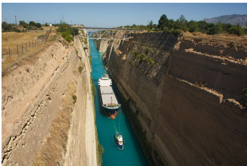
Le canal de Corinthe

Nous prendrons directement la route en direction du Péloponnèse. Le Péloponnèse est séparé de la Grèce continentale par le célèbre canal de Corinthe. Ce canal a été creusé à l'initiative des français entre 1882 et 1893 et permet d'éviter aux bateaux un détour de 400km. Le canal est long de 6343 mètres, large de 21 mètres et d'une profondeur de 52 mètres en son point le plus haut. Il a nécessité 11 millions de m3 de terrassements ! Aujourd'hui dédié principalement aux bateaux de tourisme, cet ouvrage reste néanmoins l'une des plus importantes « tranchée » verticale créée par la main de l'homme.