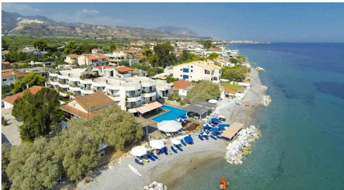
L'hôtel Lido, en bord de mer...